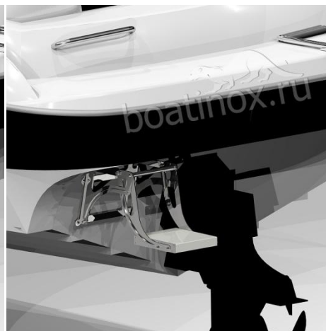
В положении ступеньки для дайвинга