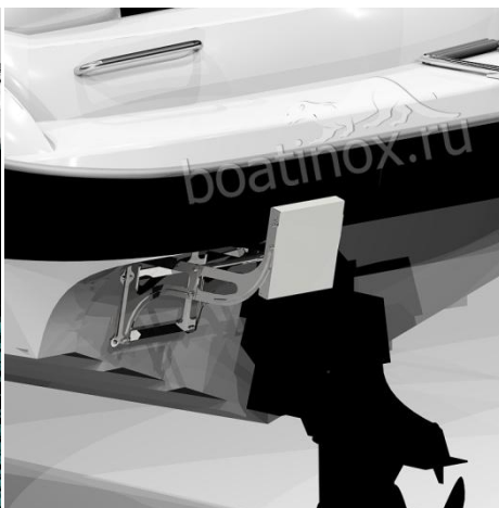
В положении дополнительного транца