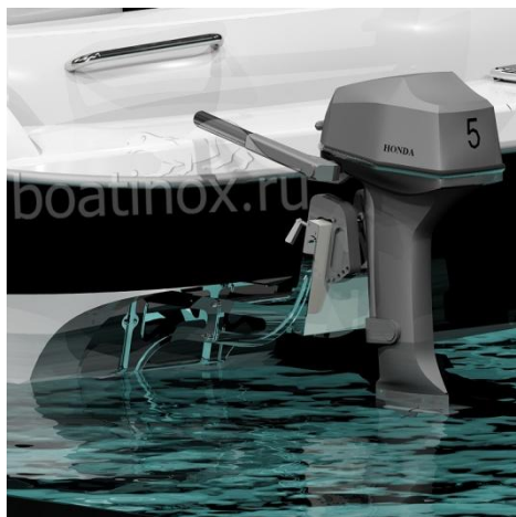
В положении дополнительного транца, двигатель установлен