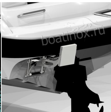
В положении дополнительного транца