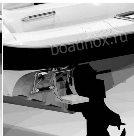
В положении ступеньки для дайвинга