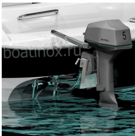
В положении дополнительного транца, двигатель установлен